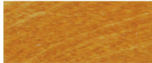
Lärche (Art. 481)