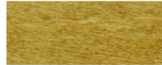
Eiche hell (Art. 482)