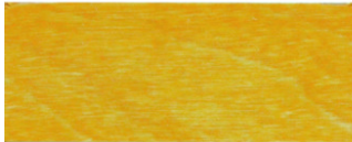
Kiefer (Art. 480)